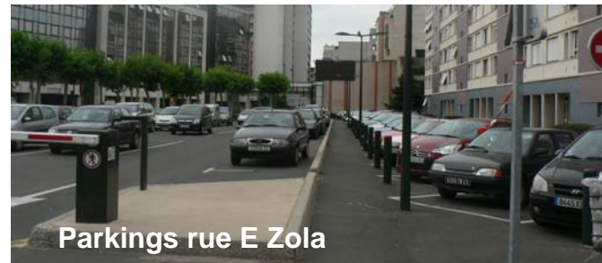
Parkings rue E Zola