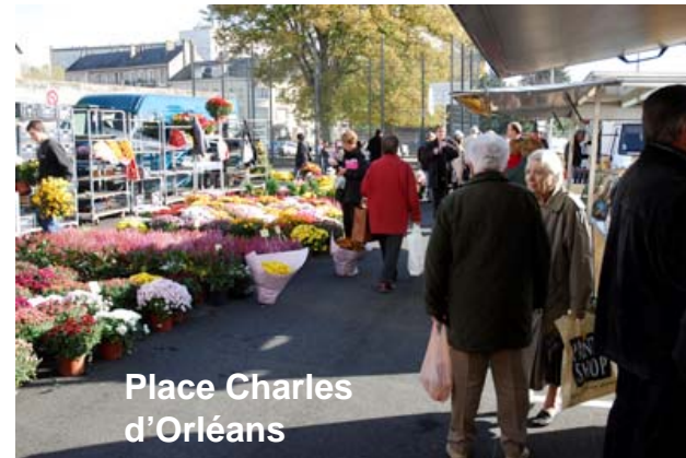
Place Charles d'Orléans