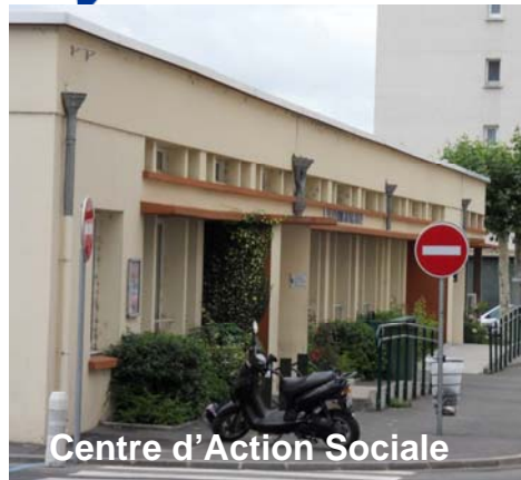
Centre d'Action Sociale

Des aménagements ont été réalisés, notamment depuis 2001