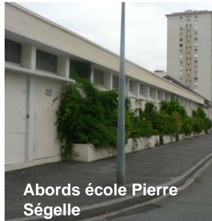
Abords école Pierre Ségelle