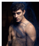
Jakub Josef Orlinski